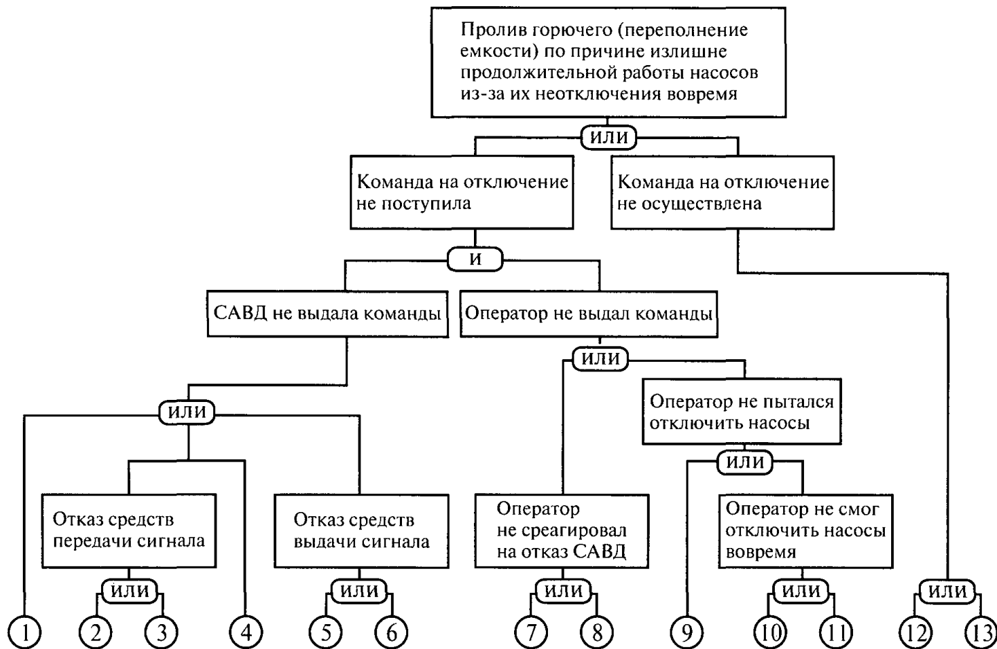
Рис. 2. «Дерево отказа» заправочной операции