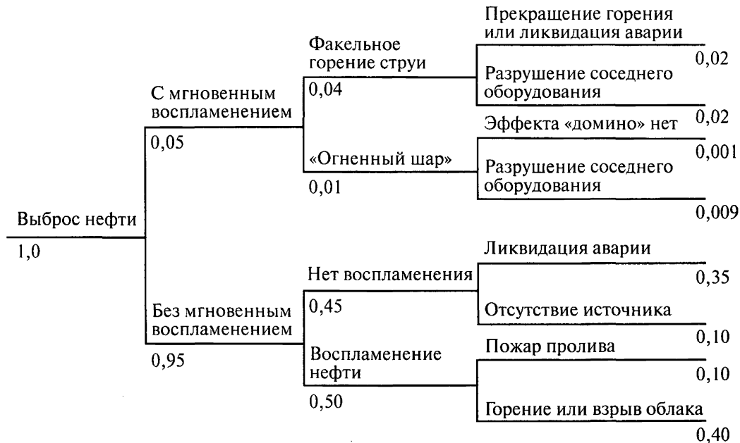
Рис. 1. «Дерево событий» аварий на установке первичной переработки нефти