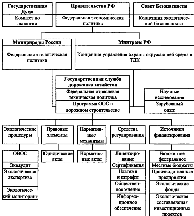
Рис. 2. Структурные элементы программы охраны окружающей среды в ТДК

Отраслевая программа экологической безопасности является частью федеральной программы «Дороги России XXI века», а также частью федеральной системы охраны окружающей природной среды РФ. Основные структурные элементы отраслевой программы ООС и схема ее взаимодействия с основными государственными природоохранными приведены на рис. 2.