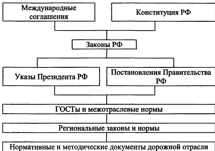
Рис. 1. Законодательные уровни природоохранных норм в дорожной отрасли

Правительства РФ. В их полномочия входит утверждение нормативов, участие в разработке стандартов, государственной экологической экспертизе, экологическая информация населения и ряд других вопросов.