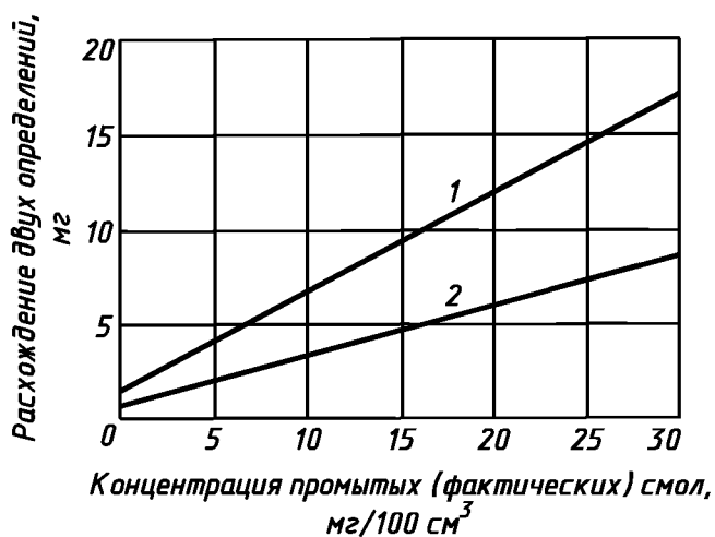
Рисунок 3 — Точность определения содержания непромытых смол