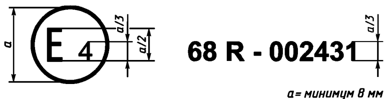
Образец А (см. 4.4.1 настоящих Правил)

Приведенный выше знак официального утверждения, проставленный на транспортном средстве, указывает, что этот тип транспортного средства официально утвержден в Нидерландах (E4) в отношении измерения максимальной скорости на основании Правил № 68 под номером 002431. Первые две цифры номера указывают на то, что официальное утверждение было предоставлено в соответствии с требованиями Правил № 68 в их первоначальном варианте.