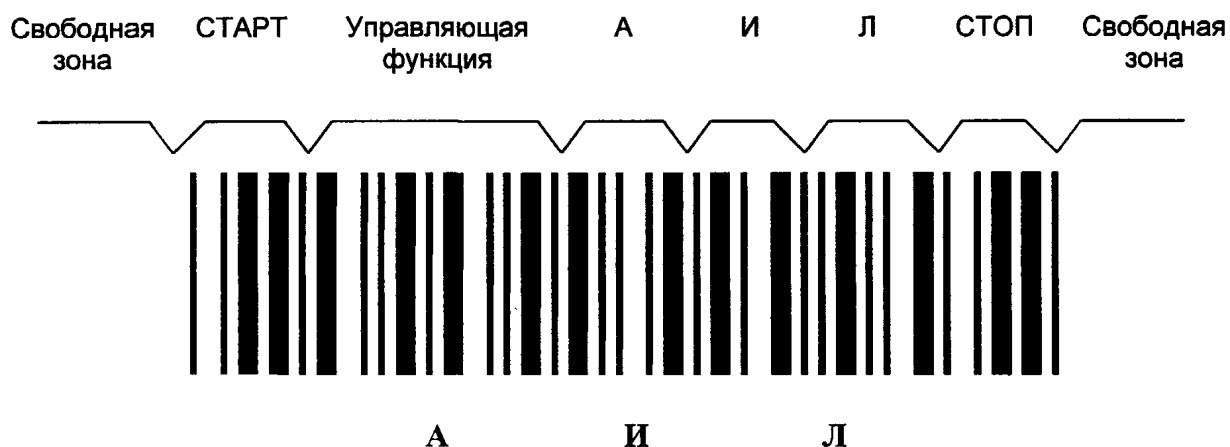
Рисунок Е.1 — Символ штрихового кода, в котором закодированы знаки АИЛ

Е.7 Для обеспечения дополнительной надежности при передаче данных с буквами русского алфавита используют контрольный знак символа набора Код 39РУ.