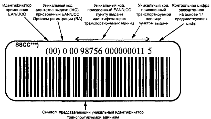
Рисунок В.1 — Пример представления уникальной идентификации транспортируемых единиц в символическом коде EAN/UCC 128 с идентификатором применения EAN/UCC «00» и визуальным представлением

В.1 Пример представления уникальной идентификации транспортируемых единиц в символическом коде EAN/UCC 128* с идентификатором применения EAN/UCC** «00» и визуальным представлением приведен на рисунке В.1.