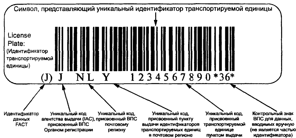
Рисунок В.2 — Пример представления уникальной идентификации транспортируемых единиц в символике штрихового кода Code 128 (Код 128)

В.2 Пример представления уникальной идентификации транспортируемых единиц в символике штрихового кода Code 128 (Код 128)** с идентификатором данных FАCT (ФАКТ)*** «Ј» и визуальным представлением приведен на рисунке В.2.