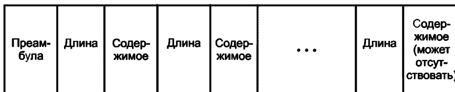
Рисунок 2 — Кодирование значения длинных данных