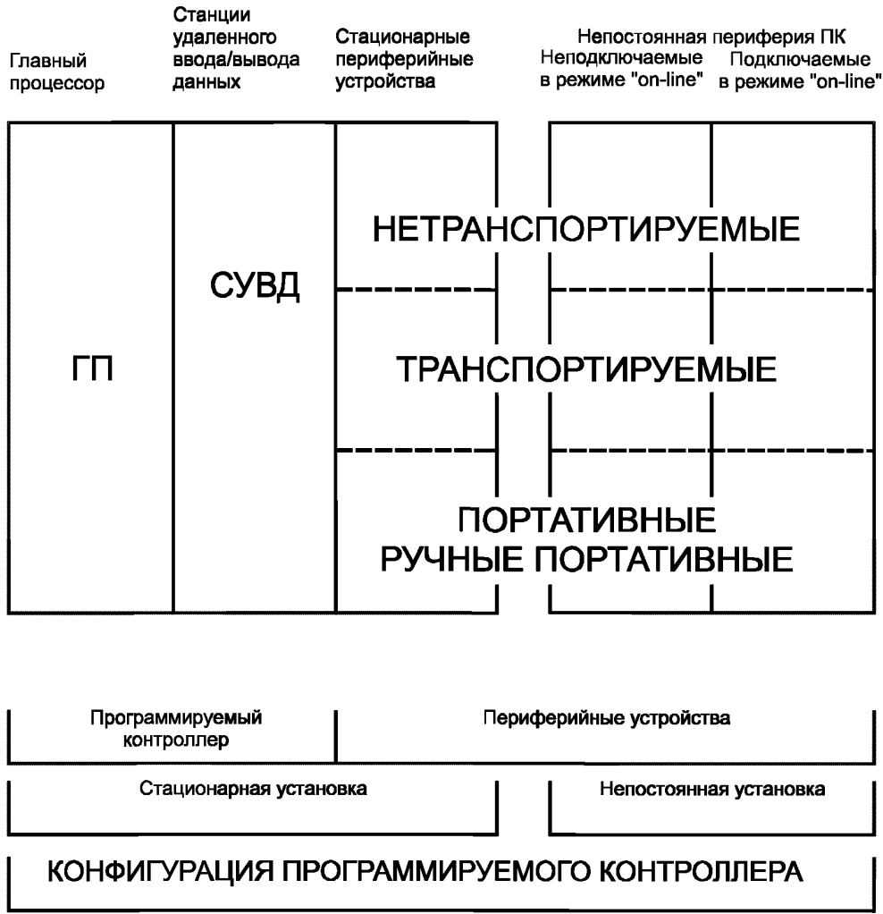
Рисунок А.1 — Конфигурация программируемого контроллера

На рисунке А.1 показана связь между определениями, относящимися к техническим средствам программируемых контроллеров.