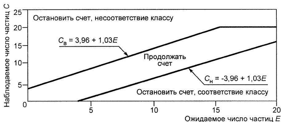
Рисунок F.1 — Границы соответствия и несоответствия классам чистоты при использовании метода последовательного отбора проб

На рисунке F.1 по оси абсцисс отложены значения ожидаемого числа частиц E , если концентрация частиц равна максимально допустимому значению для заданных размеров частиц и класса чистоты (В.4.2). По оси ординат отложены значения наблюдаемого числа частиц C в пробе.