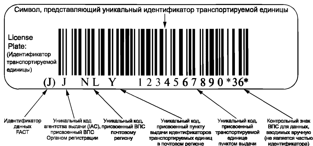
Рисунок В.2 — Пример представления уникальной идентификации транспортируемых единиц в символике штрихового кода Code 128 (Код 128)

В.2 Пример представления уникальной идентификации транспортируемых единиц в символике штрихового кода Code 128 (Код 128)** с идентификатором данных FАCT (ФАКТ)*** «J» и визуальным представлением приведен на рисунке В.2.