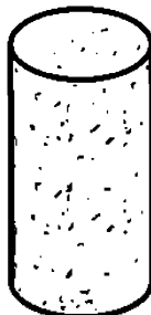
Рисунок 2 — Агломерированная корковая пробка

4.1.2 Агломерированные корковые пробки — это пробки, корпус которых целиком состоит из агломерата (рисунок 2). Пробки этого типа не следует использовать для игристых вин.