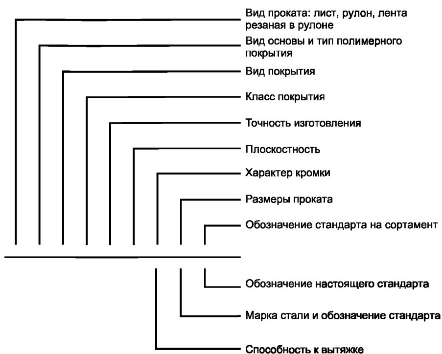
Схема условных обозначений проката с полимерным покрытием

Примечание — При отсутствии какого-либо из параметров его выбирает предприятие-изготовитель.