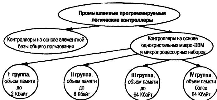
Рис. 1. Условная классификация промышленных контроллеров

На рис. 1 показана условная классификация промышленных контроллеров.