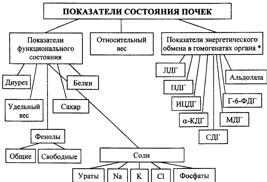
СХЕМА 6. Изучение функционального состояния почек.