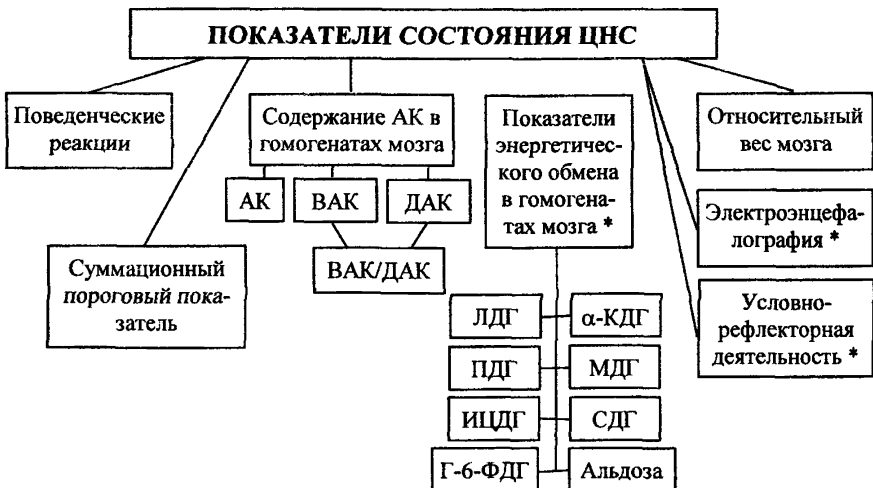
СХЕМА 2. Изучение функционального состояния центральной нервной системы.