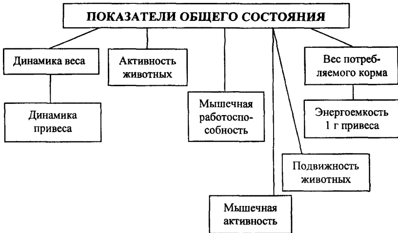
СХЕМА 1. Изучение общего состояния подопытных животных.