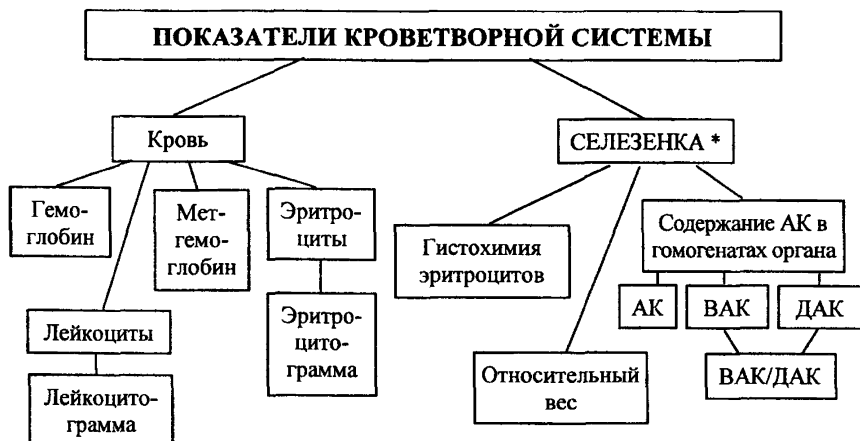
СХЕМА 7. Изучение функционального состояния кроветворной системы.