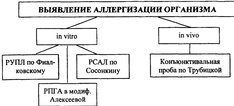
СХЕМА 9. Изучение аллергенной активности.