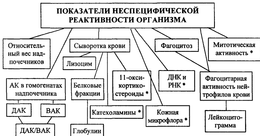
СХЕМА 3. Изучение неспецифической реактивности организма.