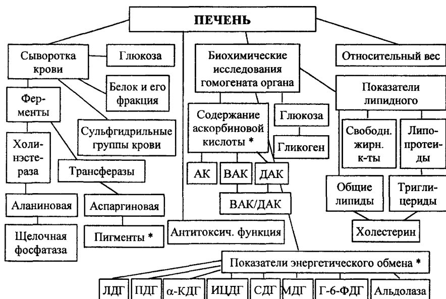
СХЕМА 4. Изучение функционального состояния печени.