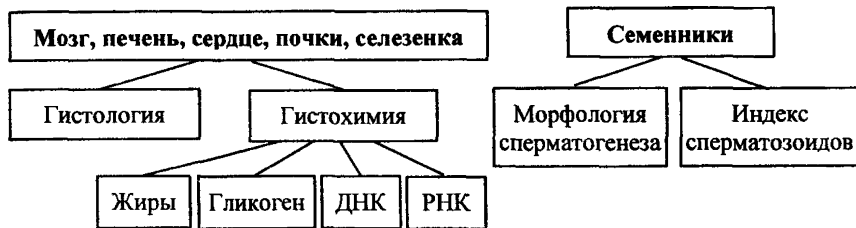
СХЕМА 10. Морфологические исследования органов.

* – тесты, исследования которых не являются обязательными