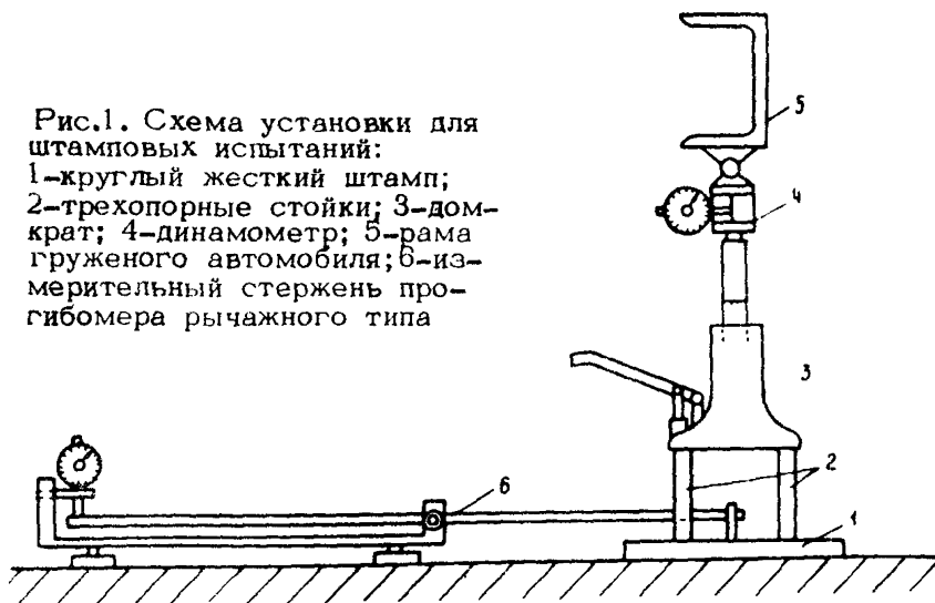
Рис.1. Схема установки для штамповых испытаний: 1-круглый жесткий штамп; 2-трехопорные стойки; 3-дом- крат; 4-динамометр; 5-рама груженого автомобиля; 6-из- мерительный стержень про- гибомера рычажного типа

Нагрузка на поверхность испытываемой конструкции передается через круглый жесткий штамп (1) и домкрат (3), упираемый в раму груженого автомобиля (5). Величина нагрузки на штамп измеряется с помощью механического динамометра (4). Домкрат устанавливается соосно на трехопорных стойках (2).