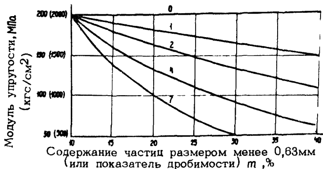
Рис.3.1. Зависимость модуля упругости основания от содержания частиц размером менее 0,63 мм (цифры на кривых - число пластичности мелких частиц)

х) Над чертой - модуль упругости осадочных пород, под чертой - магматических.