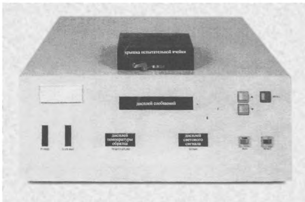
Рисунок А.1 — Внешний вид аппарата

П р и м е ч а н и е — Полное описание оборудования, инструкции по его монтажу, схемы и инструкции по техническому обслуживанию содержатся в руководствах изготовителя, которые прилагаются к каждому прибору и включаются в исследовательский отчет.