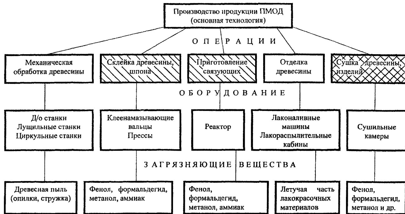
Рис.2.1. Классификация источников загрязнения газопылевых выбросов предприятий механической обработки древесины