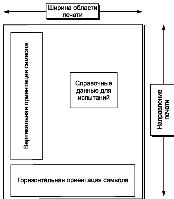
Рисунок А.1 — Образец тестового макета

Макет, изображенный на рисунке А.1, представляет рекомендуемое расположение тестовых символов штрихового кода на тестовой этикетке. Размеры этикетки не определены, ее ширина должна соответствовать ширине области печати конкретного принтера, на котором проводят испытание, а число символов символика и относительное расположение тестовых символов может быть уточнено. Область печати должна распространяться на всю ширину макета, за исключением мест, оставленных для свободных зон до знака Start (СТАРТ) и после знака Stop (СТОП) в тестовых символах.