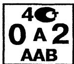
Рисунок А.4 - Поверительное клеймо, применяемое метрологической службой юридического лица при клеймении средств измерений, находящихся в эксплуатации или после ремонта