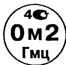
Рисунок А.1 – Поверительное клеймо ГНМЦ