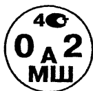
Рисунок А.1 – Поверительное клеймо ЦСМ