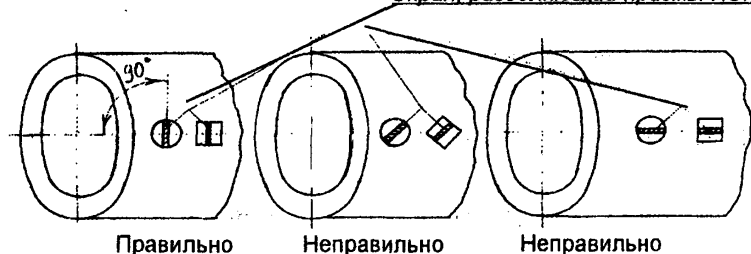
Рис.1 Схема установки раздельно-совмещенных ПЭП при измерении толщины стенок трубчатых элементов

10.4. Считывают результаты измерения после получения устойчивого и достоверного показания. Для цифровых толщиномеров оно характеризуется либо одним значением, либо двумя, изменяющимися в пределах дискретности прибора. В последнем случае фиксируется меньшее значение.