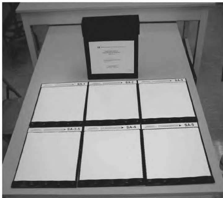
Рисунок 2 — Трехмерные эталоны гладкости

4.3 Трехмерные эталоны гладкости (см. рисунок 2).