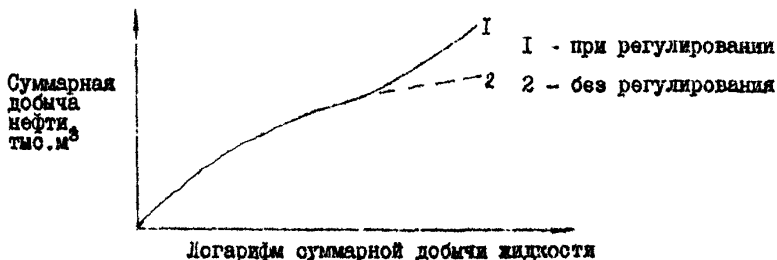
Рис. 8.1 - Характеристика вытеснения при регулировании процесса разработки

Анализируются только те методы, которые применялись на месторождении. Поясняются причины и цели проведения каждого мероприятия по регулированию, объем внедрения, полученные результаты и технико-экономический эффект от внедрения.