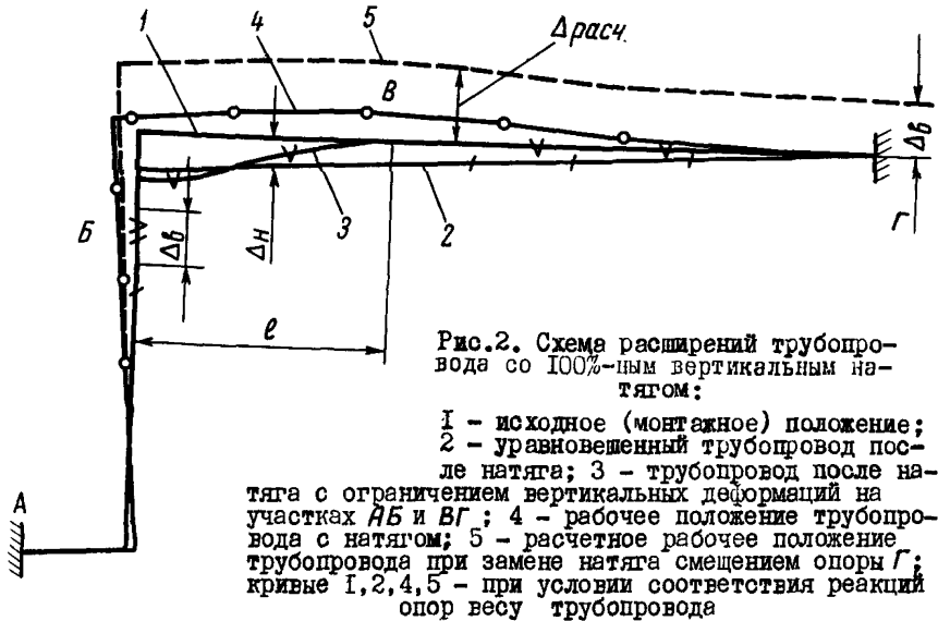
Рис.2. Схема расширений трубопровода со 100%-ным вертикальным натягом:

1 - исходное (монтажное) положение; 2 - уравновешенный трубопровод после натяга с ограничением вертикальных деформаций на участках АВ и ВГ ; 3 - трубопровод после натяга с натягом; 4 - рабочее положение трубопровода с натягом; 5 - расчетное рабочее положение трубопровода при замене натяга смещением опоры Г ; кривые 1, 2, 4, 5 - при условии соответствия реакции опор весу трубопровода