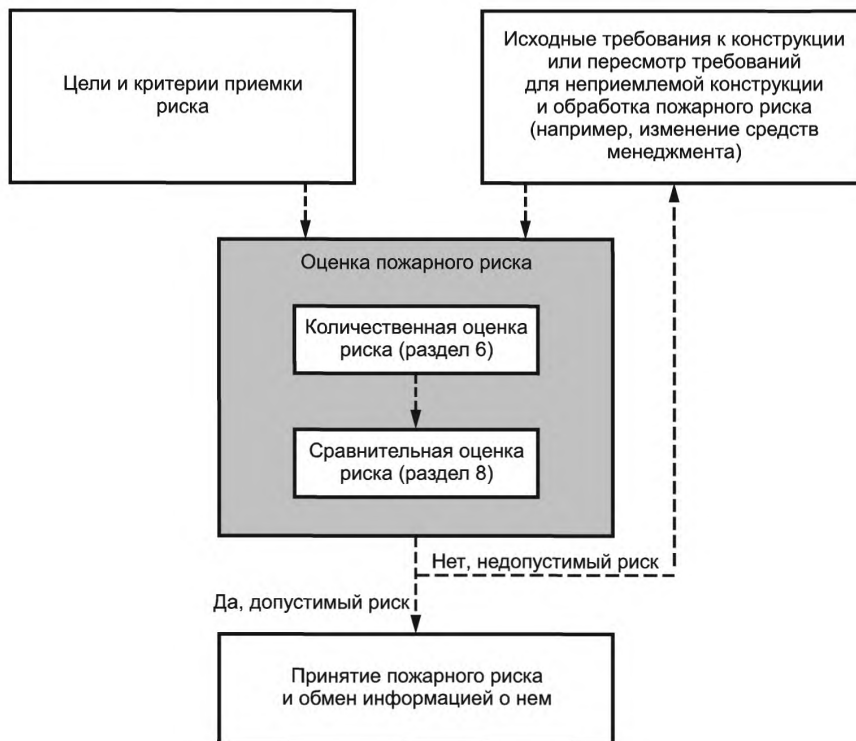
Рисунок 1 — Схема менеджмента пожарного риска

Менеджмент риска включает оценку риска, обработку риска, принятие риска и обмен информацией о риске. После обработки риска может потребоваться повторная оценка риска (см. рисунок 1). Оценка пожарного риска может также быть использована для оценки сценариев пожара альтернативных конструкций объекта защиты до выбора конкретной конструкции или внесения изменений в существующую конструкцию объекта защиты и направлена на достижение выполнения критериев допустимости и соответствия установленным требованиям.