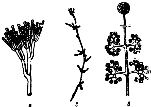
Рис. 2. Плесени: а — Penicillium , б — Cladosporium herbarum , в — Thamnidium

отрицательных температурах (до -9^{\circ}\text{C} ). На мясе класпориум образует темно-зеленые и почти черные пятна, которые могут проникать в глубину мышечной ткани. На масле класпориум образует черные пятна и, кроме того, может вызывать "внутреннее" плесневение масла, развиваясь в микростотах продукта.