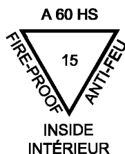
Рисунок 2 — Пример маркировки

Пример маркировки прозрачного термически закаленного безопасного стекла с основным стеклом толщиной 15 мм, имеющего тип огнестойкости «A-60», приведен на рисунке 2.