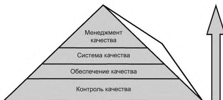
Рисунок 1 — Пирамида качества

Руководству лаборатории следует признать, что существует иерархия понятий, используемых для описания системы менеджмента качества услуг в области здравоохранения. Эти понятия, выстроенные с точки зрения управления, начинаются с общей философии менеджмента качества, в которой выражено стремление достичь качественных (безопасных, эффективных, своевременных и ориентированных на пациента) услуг в системе здравоохранения. Эта философия обычно охватывает менеджмент качества, который направлен на поддержание скоординированных и всеобъемлющих усилий соответствовать целям системы здравоохранения в области качества. Эти усилия известны как «система качества», которая включает в себя все виды деятельности в области обеспечения качества (часть менеджмента качества, сфокусированная на достижении уверенности в том, что требования к качеству будут выполнены) [1], а также все виды деятельности по контролю качества (часть менеджмента качества, сфокусированная на выполнении требований к качеству) [1] (см. рисунок 1).