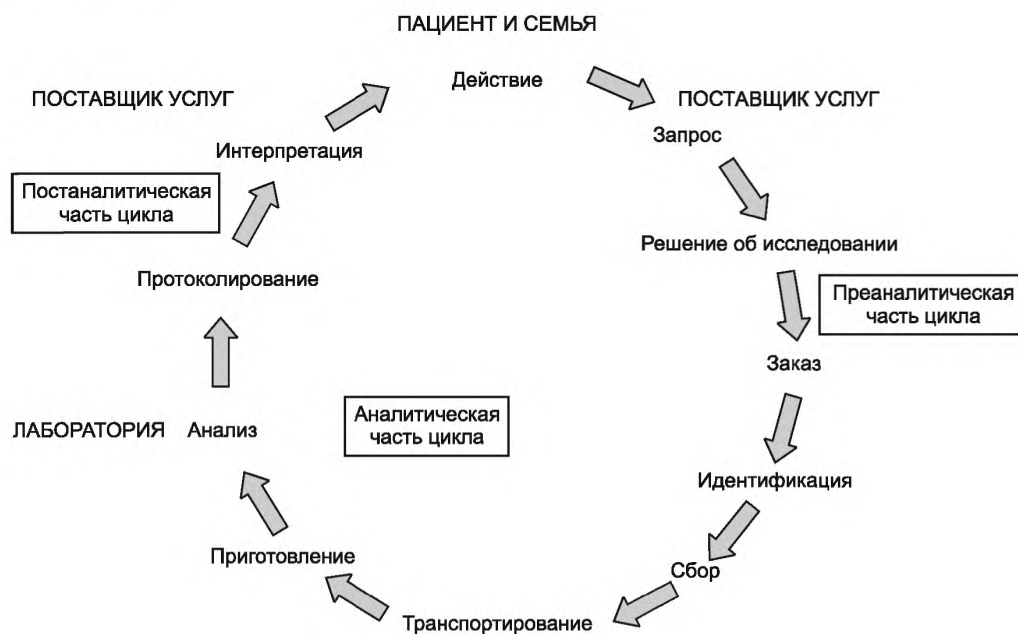
Рисунок 2 — Медицинская лаборатория. Полный цикл исследования

Необходимо постоянно проверять этот цикл для выявления возможности улучшения лабораторных услуг, например, путем сокращения числа образцов, не пригодных для исследований, которые получает лаборатория.