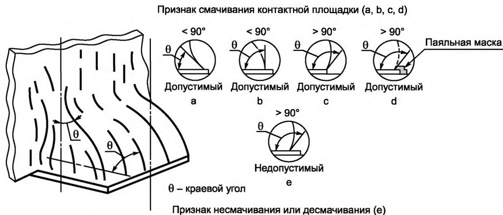
Рисунок 1 — Варианты краевого угла смачивания припоя \theta , виды состояний

Допустимое паяное соединение должно проявлять признак смачивания и сцепления, если припой сочетается с паяемой поверхностью, образуя краевой угол смачивания 90^\circ или меньше, за исключением случаев, когда количество припоя приводит к контуру, который заходит за края контактной площадки (рисунок 1). Рекомендуется, чтобы паяные соединения имели в основном глянцевый вид. Допустим атласный блеск.