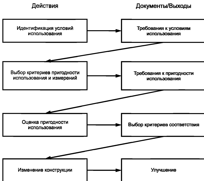
Рисунок 2 — Деятельность по установлению и документированию пригодности использования продукции