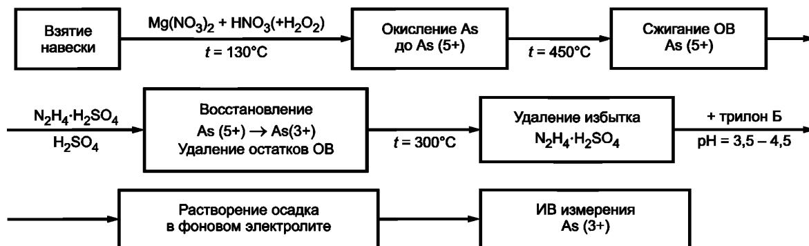
Рисунок 2 — Основные этапы подготовки проб пищевых продуктов и продовольственного сырья при проведении ИВ измерений для определения массовых концентраций мышьяка

Повторно обрабатывают пробу азотной кислотой объемом 2—3 см 3 с добавлением 0,5 см 3 пероксида водорода. Эту операцию повторяют еще 2—3 раза. Последний раз упаривают пробу до сухого остатка.