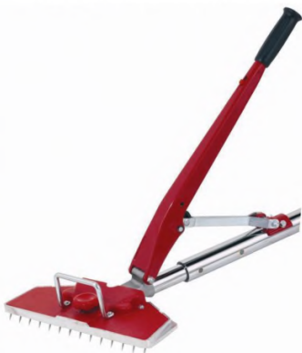
Рис.2. Повер- стретчер

Натягивание коврового покрытия в небольших по площади помещениях следует начинать с угла. Коленный стретчер устанавливается на покрытие в нескольких сантиметрах от рейки. Одной рукой необходимо слегка надавливать на захват стретчера, другой рукой — слегка подтягивать материал на гвозди.