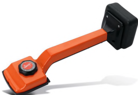
Рис.1. Коленный стретчер

При устройстве коврового покрытия в небольших помещениях рекомендуется использовать коленный стретчер (см. рис.1), а в больших помещениях – повер-стретчер (см. рис.2).