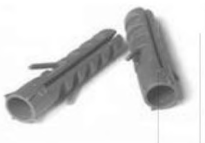
Рисунок 2 – Внешний вид пластикового дюбеля

- с помощью пластиковых дюбелей (тип и размеры указываются в проекте на монтаж системы диспетчерского контроля), устанавливаемых в просверленные (пробитые) гнезда (пример пластикового дюбеля представлен на рисунке 2);