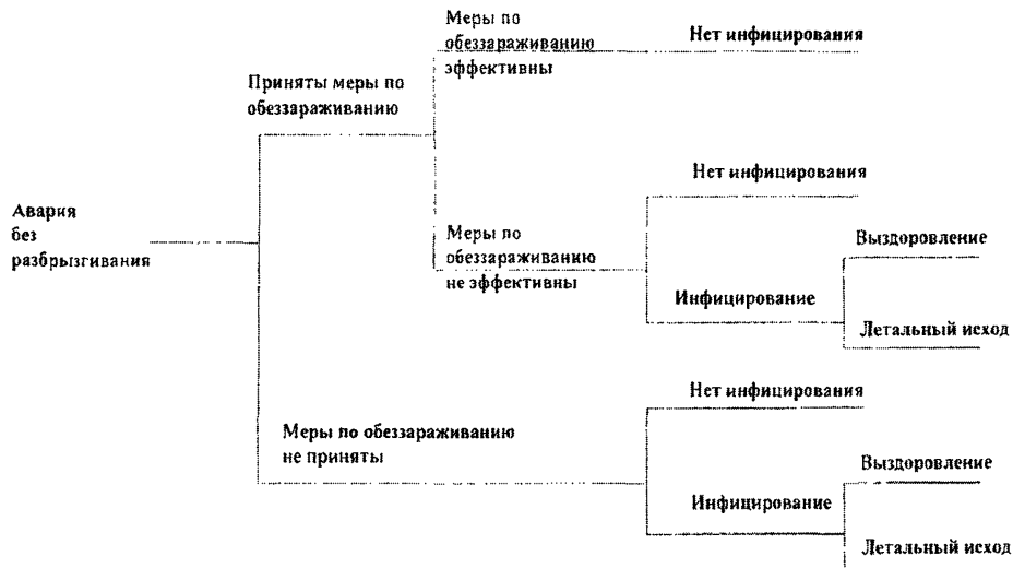
Пример 2. Дерево событий и сценариев развития аварии без разбрызгивания ПБА