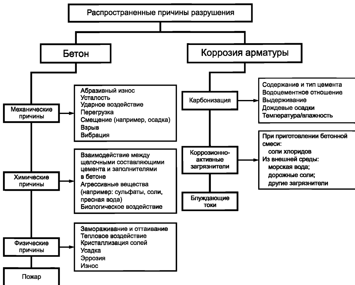
Рисунок 1 — Распространенные причины разрушений конструкций

Дальнейшей оценке подлежат примерный объем и вероятная интенсивность прироста дефектов. Следует определять, когда бетонная конструкция или ее элемент больше не будут функционировать так, как предполагалось, без принятия мер по защите или ремонту (не считая мер технического обслуживания находящегося в эксплуатации систем).