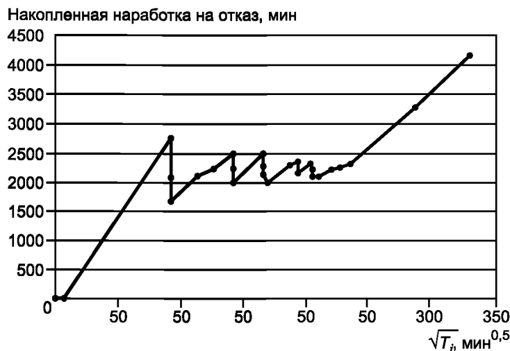
Рисунок Б.1 — График роста безотказности по данным таблицы Б.1