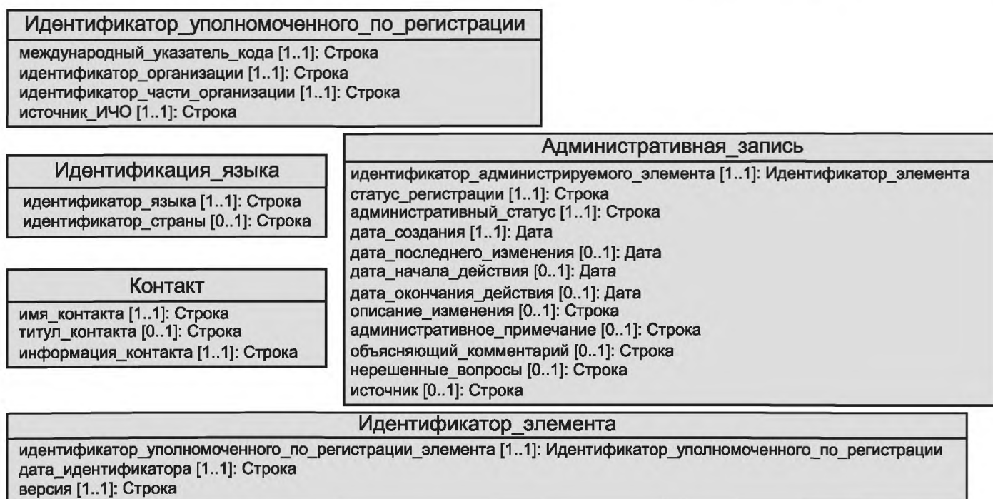
Рисунок А.4 — Область администрирования и идентификации — классы, используемые в качестве составных типов данных