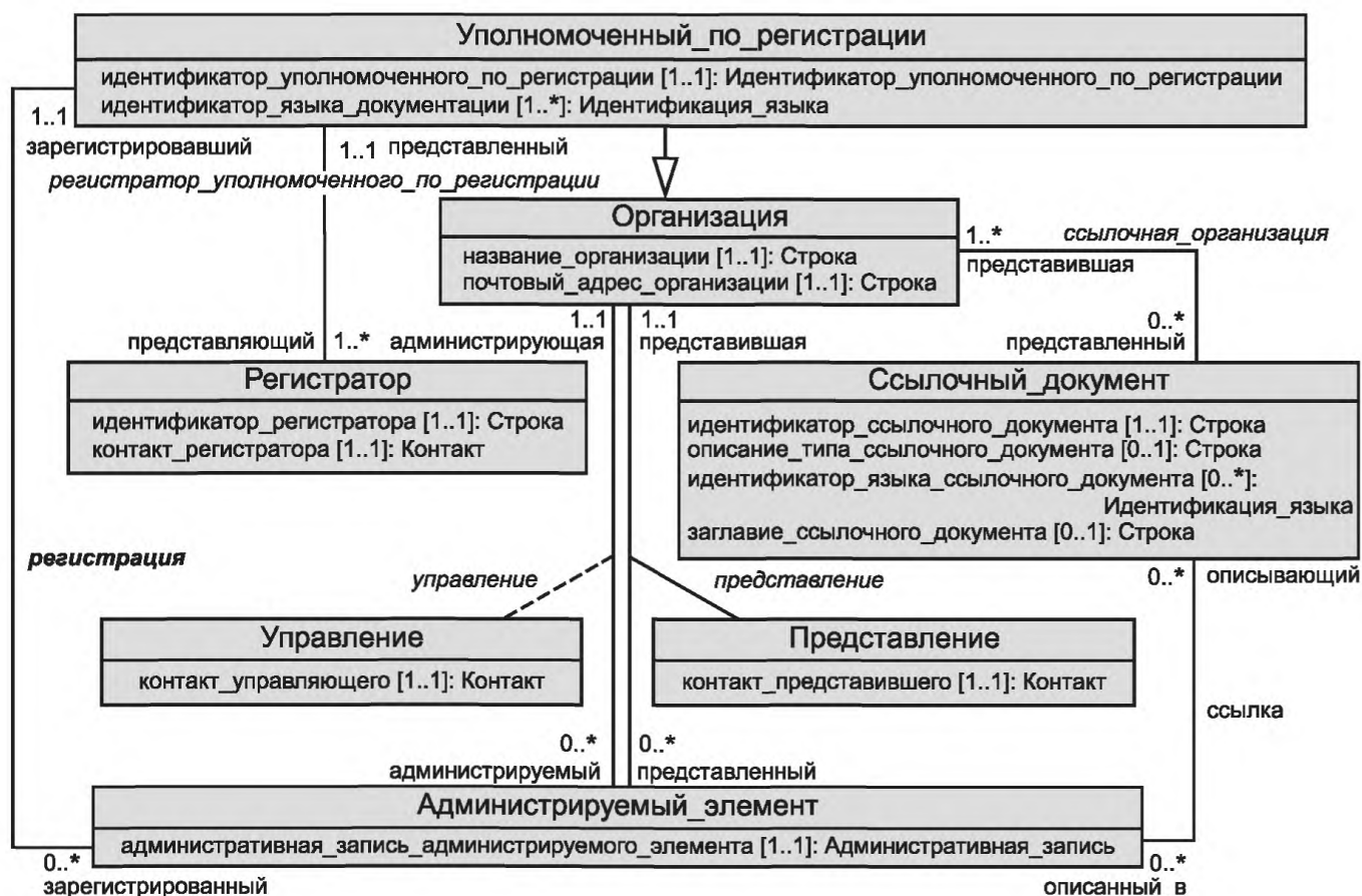
Рисунок А.3 — Область администрирования и идентификации метамодели