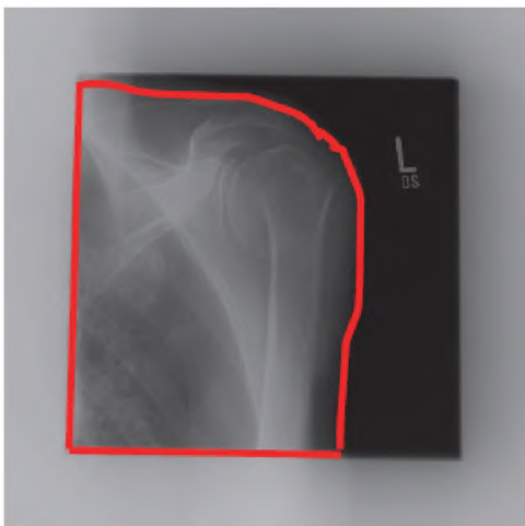
Рисунок А.1 – Типичный пример ИСХОДНЫХ ДАННЫХ рентгенограммы с подчеркнутой ОПОРНОЙ ОБЛАСТЬЮ ИЗОБРАЖЕНИЯ

ПОКАЗАТЕЛЬ ЭКСПОЗИЦИИ в значительной степени зависит от ОПОРНОЙ ОБЛАСТИ ИЗОБРАЖЕНИЯ. Поскольку настоящий стандарт не определяет выбора ОПОРНОЙ ОБЛАСТИ ИЗОБРАЖЕНИЯ, вполне возможны отклонения для различных РЕНТГЕНОВСКИХ ЦИФРОВЫХ СИСТЕМ. При выборе ОПОРНОЙ ОБЛАСТИ ИЗОБРАЖЕНИЯ необходимо учитывать, что типичные изображения в рентгенологии охватывают широкий диапазон значений ВОЗДУШНОЙ КЕРМЫ НА ПРИЕМНИКЕ ИЗОБРАЖЕНИЯ. Типичный вид ИСХОДНЫХ ДАННЫХ рентгенограммы представлен на рисунке А.1.