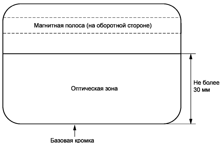
Рисунок 2 — Карта с магнитной полосой

Расположение и размеры магнитной полосы должны соответствовать ИСО/МЭК 7811-2, ИСО/МЭК 7811-6, ИСО/МЭК 7811-7 или ИСО/МЭК 7811-8. Обычно магнитную полосу располагают на стороне карты, противоположной оптической зоне.