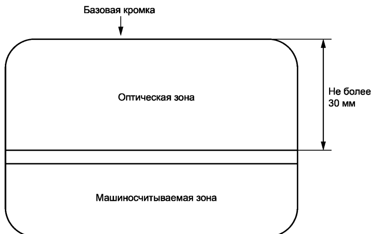
Рисунок 1 — Карта с MRZ