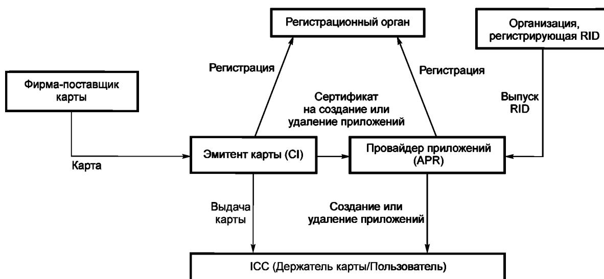
Рисунок А.1 — Модель независимых эмитента карты и провайдера приложения

Примечание — Следующее поколение IC Card System Study Group 1) (NICSS) использует данную модель.