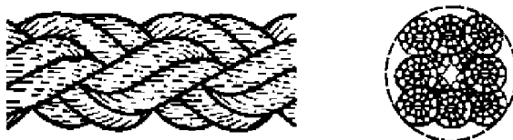
Рисунок 3 — Конфигурация 8-рядного плетеного каната (тип L)

5.2 Конструкция, изготовление, шаг крутки, маркировка, упаковка и поставляемые длины должны соответствовать ISO 9554.