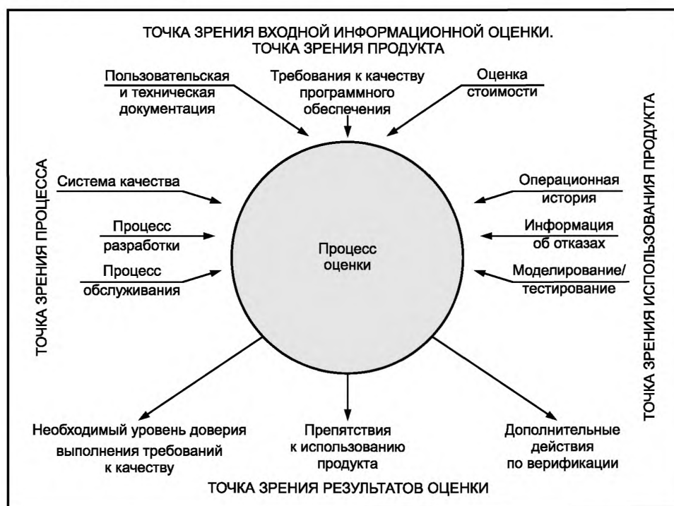
Рисунок 5 — Процесс оценки качества продукции с точки зрения приобретателя

На этом рисунке показано, что оценка продукции может учесть информацию с других точек зрения, таких как точка зрения продукции, процесса и использования продукции, в результате чего формируется точка зрения результатов оценки.