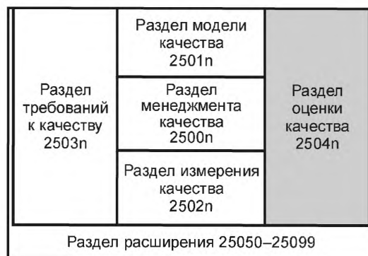
Рисунок 1 — Организация SQuaRe серии международных стандартов

В модель SQuaRE входят следующие разделы: