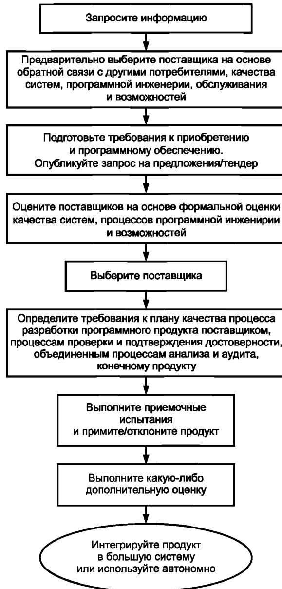
Рисунок 4 — Пример процесса оценки/приобретения или модификации заказной программной продукции

Процесс оценки может быть объединен с процессом приобретения, определенным в ИСО/МЭК 1220, краткое описание которого представлено ниже. Таким образом, результаты оценки могут способствовать достижению конечной цели — приобретению: