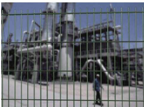
Рис. 1.1. - Примеры сетчатых панелей.