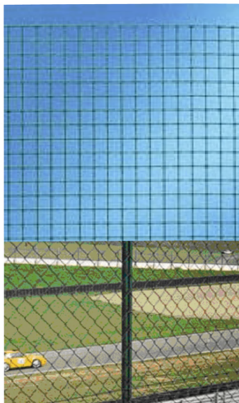
Рис. 1.9 - Внешний вид ограждений из гибкой плетеной сетки.

Основой ограждения является сетчатое плетеное полотно из оцинкованной сетки с диаметром проволоки от 0,55 до 2,45 мм, оцинкованной или оцинкованной с последующим покрытием полимером. Сетка поставляется в рулонах длиной кратной длине участка охраняемого периметра 5, 10, 25, 50 м. Высота в рулоне 0,5-1-1,2-1,5-2 м, размеры ячеек от 6х6 до