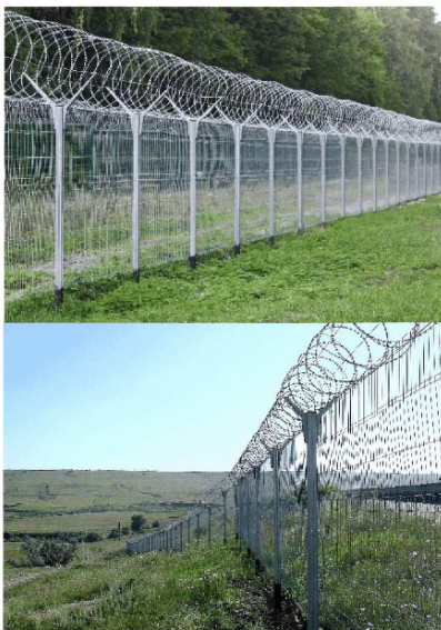
Рис. 1.3. - Основное ограждение из ССПЦ усиленное верхним спиральным барьером безопасности.

1.1.2 Ограждения из гибкой сварной сетки цельнометаллической периметровой (ССЦП) предназначены для охраны объектов различного назначения, в том числе военных и промышленных объектов, частных владений. Они могут быть использованы, как в качестве физического препятствия (рис. 1.3), так и в качестве несущей конструкции установки систем технических средств охраны.