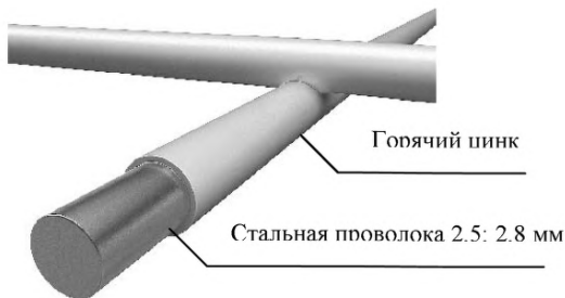
Рис. 1.4 - Противокоррозионное покрытие ССЦП.

Основой ограждения является сетчатое полотно из оцинкованной сетки ССЦП с диаметром прутка 2,8 мм (рис. 1.4). Сетка поставляется в рулонах длиной кратной длине участка охраняемого периметра 15, 25, 50 м. Сетка ССЦП имеет высоту в рулоне 862,5 мм и 1725 мм, размеры ячеек 50х50 , 50х150, 50х250 мм.