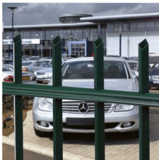
Рис. 1.7 - Декоративное металлическое ограждение.

Предприятие Базис изготавливает ограждения в виде решётчатых панелей (рис. 1.6, б) из профильной трубы сечением 40х20 мм (горизонтальные профили) и 30х18 мм (вертикальные профили). Расстояние между вертикальными профилями составляет 100 мм. Высота секций от 1 м до 2,4 м. Вертикальные профили сверху закрываются пластиковыми крышками. Для затруднения перелазы через ограждение вертикальные профили могут обрезаться под углом (рис. 1.7). Панели крепятся к опорам из профильных труб 50х50 мм и 60х60 мм.