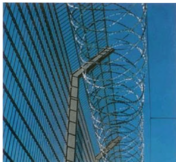
Рис. 1.10. - Комбинированное верхнее дополнительное ограждение.

1.1.11 Для охраняемых территорий, расположенных в населенных пунктах, в соответствии с архитектурно-композиционными решениями данных территорий допускается использовать, в качестве основного, ограждения со сплошным глухим жестким полотном. Материал: кирпичная кладка, бетонные плиты, металлические сварные панели, профнастил.