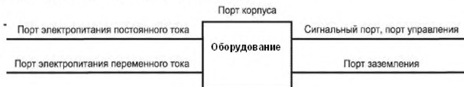
Рисунок 1 – Примеры портов

3.8 уровень жесткости (severity level): Значение воздействующей электромагнитной величины, установленное при испытании на помехоустойчивость.