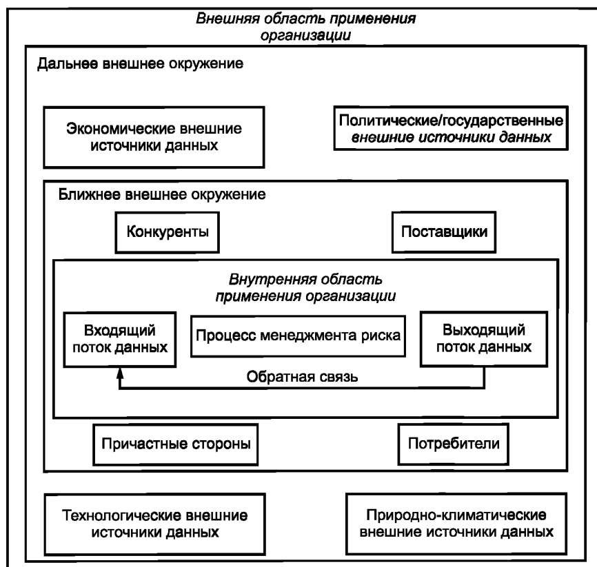
Рисунок 1 — Внешние факторы дальнего и ближнего окружения

Ближнее внешнее окружение представлено факторами делового окружения. К ним относятся потребители, поставщики, конкуренты, акционеры, инвесторы. Руководство организации способно оказывать определенное влияние на данные факторы.