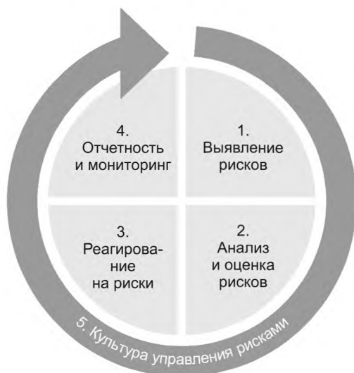
Рисунок 1 — Процесс менеджмента риска

Для идентификации риска организации малого и среднего бизнеса необходимо сформировать карту денежных потоков организации. При этом денежные потоки организации могут быть разделены на доходную (продажи товаров, выручка от оказанных услуг и т. д.) и расходную части (арендные платежи, закупка сырья,