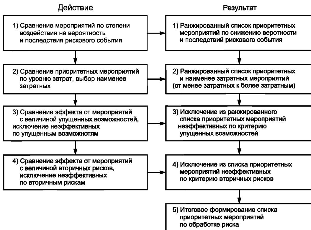
Рисунок 3 — Алгоритм формирования ранжированного списка приоритетных мероприятий по воздействию на риски организации

6) Формирование перечня приоритетных наименее затратных мероприятий с учетом дополнительных угроз и возможностей.