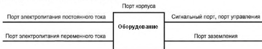
Рисунок 1 – Примеры портов

3.8 уровень жесткости (severity level): Значение воздействующей электромагнитной величины, установленное при испытании на помехоустойчивость.