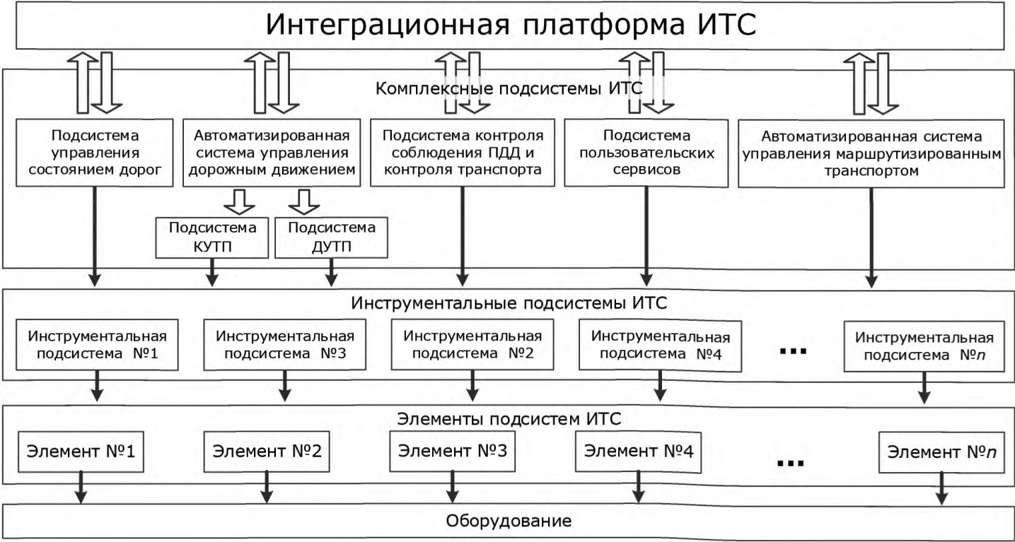
Рисунок Б.1 — Обобщенная схема физической архитектуры ЛП ИТС

Ниже представлена обобщенная физическая архитектура ИТС (см. рисунок Б.1).