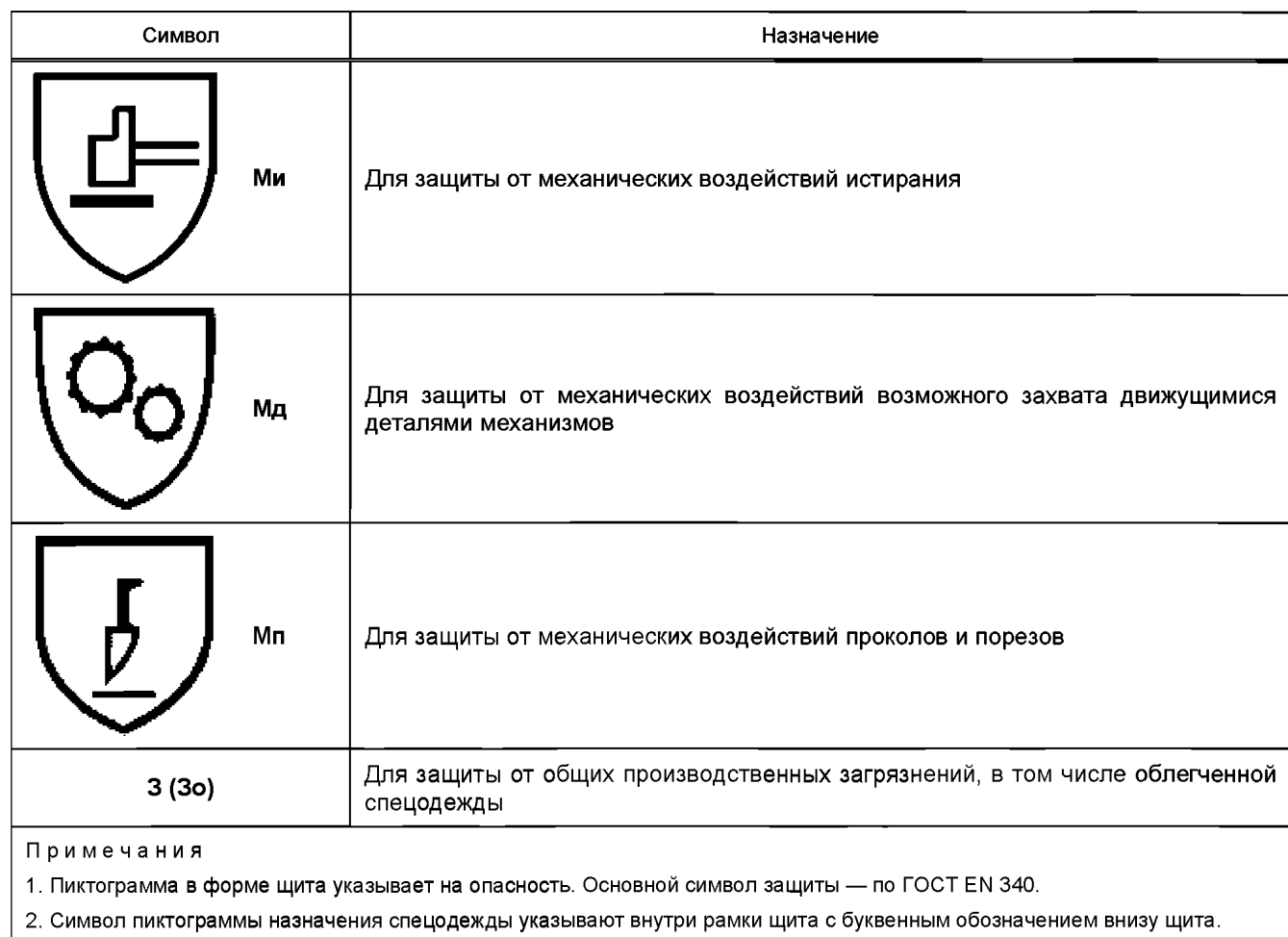
Таблица В.1 — Символы пиктограмм с указанием области применения спецодежды