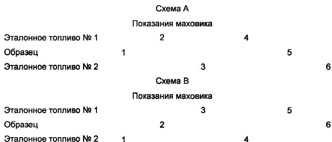
Рисунок 3 — Последовательность снятия показаний для образца и эталонных топлив

После удовлетворительного выполнения работы со смесью эталонных топлив № 2 выполняют необходимые операции для возврата двигателя к работе на эталонном топливе № 1, затем с образцом и, наконец, с эталонным топливом № 2. Для каждого топлива проверяют все рабочие параметры и перед записью показаний ручного маховика дают двигателю войти в равновесное состояние. Последовательность переключения топлив должна соответствовать схеме А (рисунок 3). Если образец, для которого эталонное топливо № 2 окажется приемлемым, испытывают сразу после первого образца, то полученное показание маховика можно использовать для нового образца. Последовательность переключения топлив в таком случае должна соответствовать схеме В (рисунок 3).